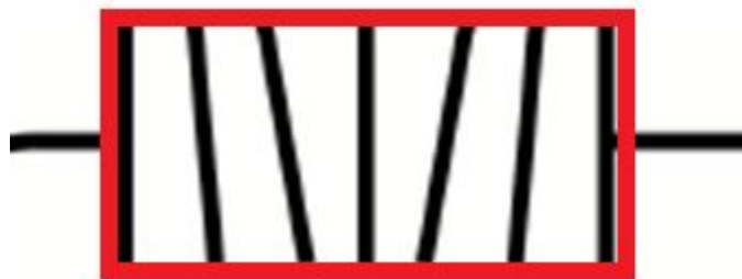
Рисунок 2. Периметр элемента «Сложная «батарея»»

4.20 Попытка считается завершенной, когда: